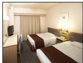
【ホテル外観・客室】

宿泊料金：通常料金よりお値打ちな特別価格にてご提供します(表示は一人様あたり、税金(8%)・サービス料込み)。