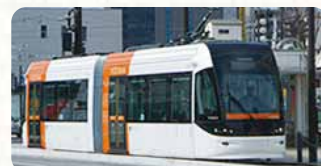
富山ライトレール